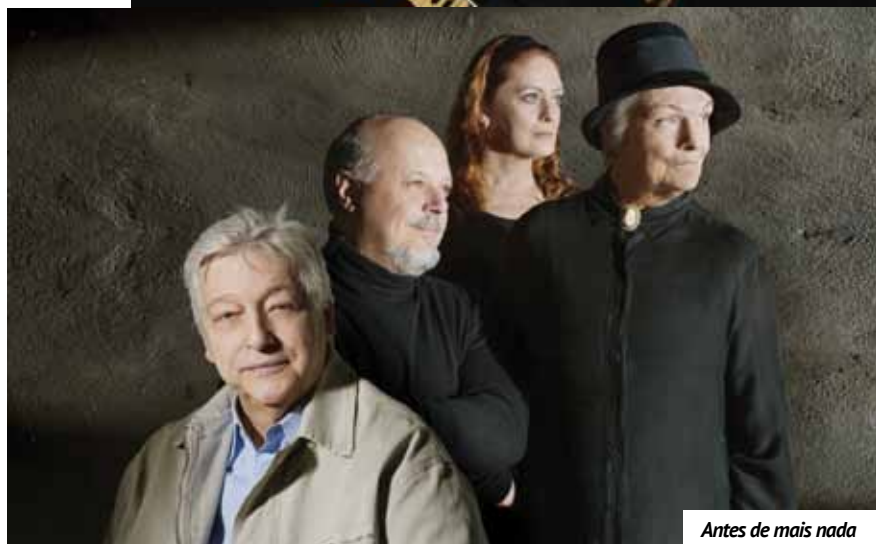
Antes de mais nada