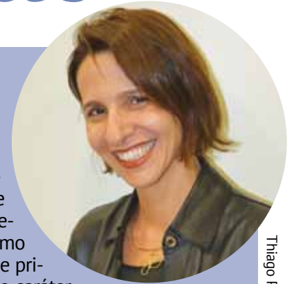
Thiago Pacheco / ACI

Juridicamente, a água é bem de uso comum e prioritário do povo. Isso lhe impõe gestão compartilhada, integrada, transversal e sustentável, sendo a bacia hidrográfica sua unidade territorial administrativa. O Direito de Águas (regime jurídico de gestão), o mais sofisticado ramo do Direito, vai além da concepção de público e privado, supera a noção federativa e contempla o caráter unitário do recurso (que deve ser protegido integralmente, como ciclo hidrológico). Percebe-se que o direito hídrico não é compreendido. Água é recurso de cooperação, o que requer governança planejada, não ato isolado de governo. Gerir água pressupõe ações impessoais de longo prazo, diagnósticos precisos e imparciais e decisões estratégicas, socioeconômicas, políticas e geopolíticas. É imperioso assegurar a gratuidade do mínimo essencial, cobrar a disponibilidade hídrica de consumo e criminalizar o uso abusivo. Não se trata de ousadia, mas de implementar o sistema jurídico já em vigor, donde se conclui pela ampla carência de educação hídrica. O Brasil tem legislação avançada, capital humano preparado e preside o Conselho Mundial de Água. Entretanto, a gestão sistêmica e multidisciplinar, característica do complexo regime jurídico que circunda a água e demais bens ambientais, requer adequar a formação e a cultura dos gestores.