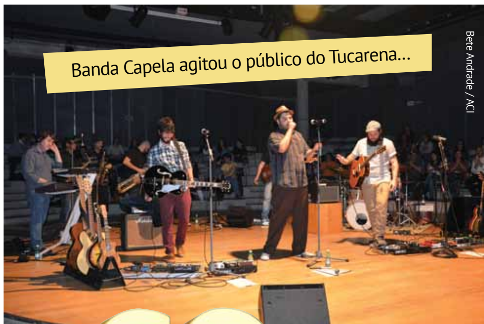
Banda Capela agitou o público do Tucarena...