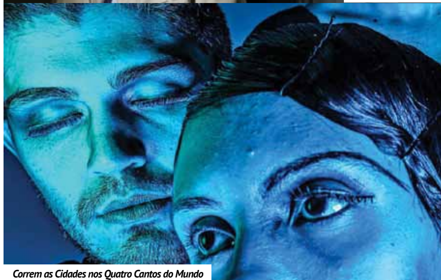
Correm as Cidades nos Quatro Cantos do Mundo