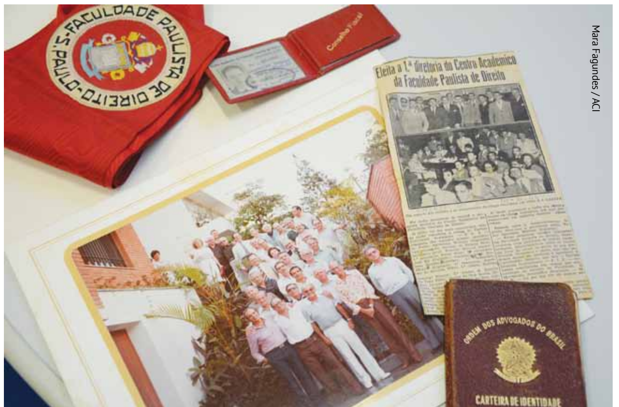
Mara Fagundes / ACI