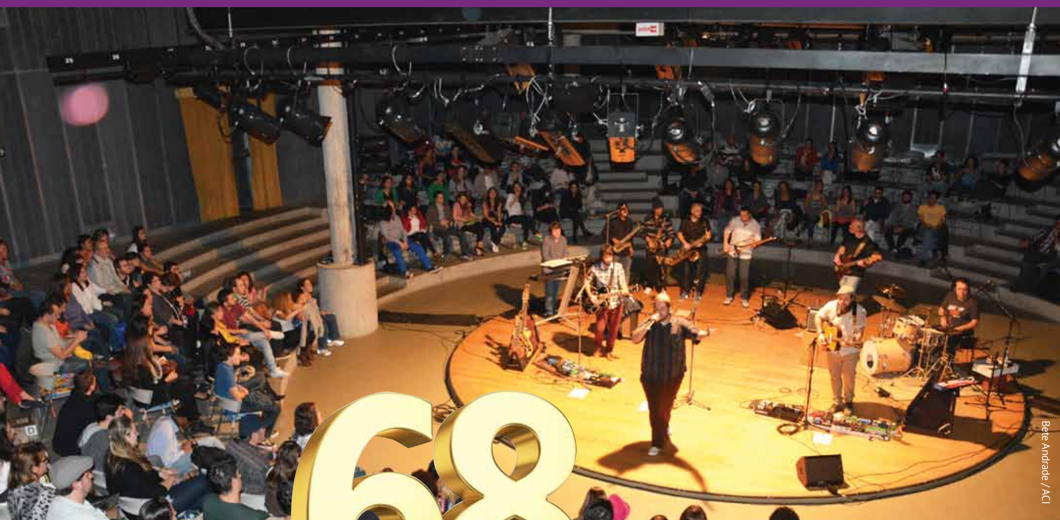
Bete Andrade / ACI