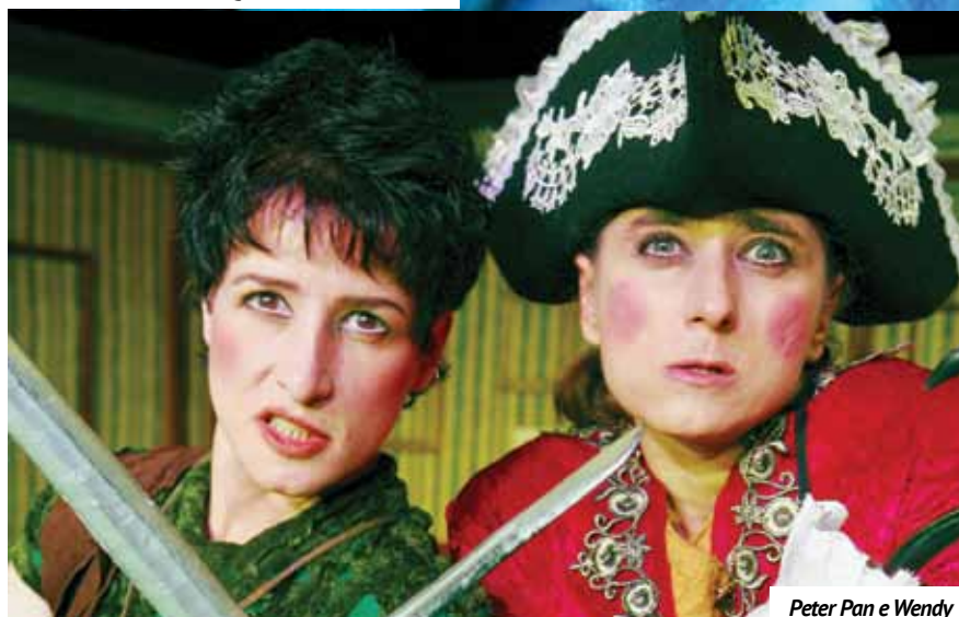
Peter Pan e Wendy